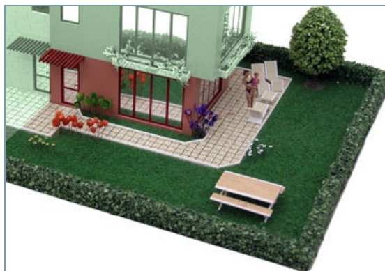
Апартамент Уно А