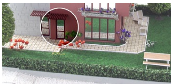
Отделна входна врата